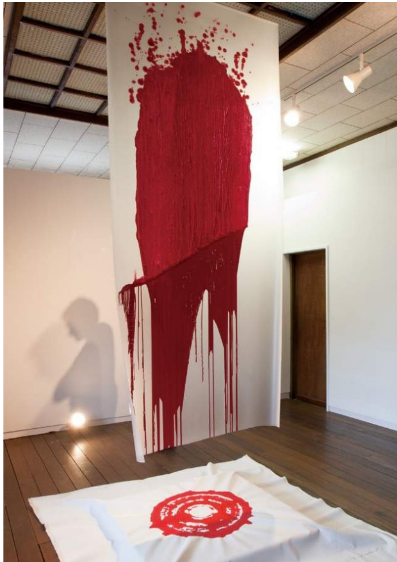
[物質の解放—Outside— Work 2014.9.6] 2014年 合成樹脂塗料・フィルム・布